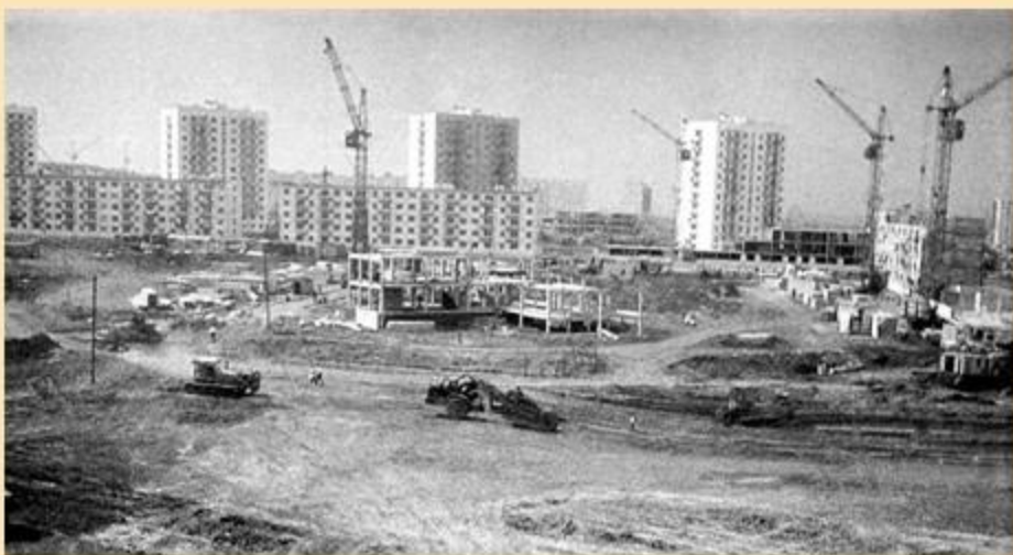
Новый город, 29 комплекс, 1972 г.

И вот, в сентябре 1972 г., ДМШ №3 распахнула двери для первых 76 учеников, которые были приняты в классы фортепиано, струнно-смычковых, духовых и народных инструментов.